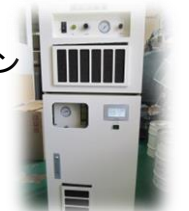
大型オゾン発生器